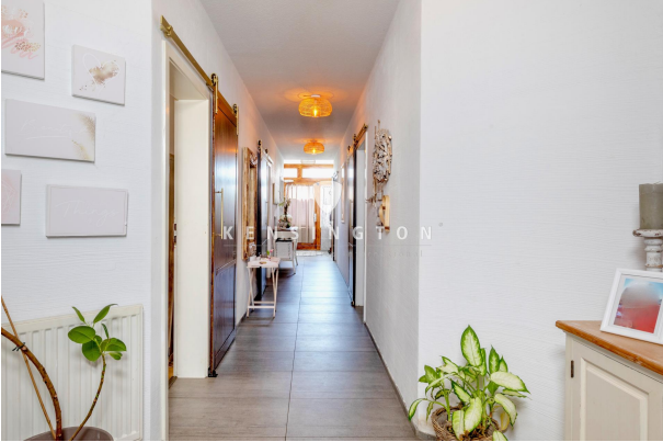
Ruheoase mit Pferden im Garten Wohnung EG rechts