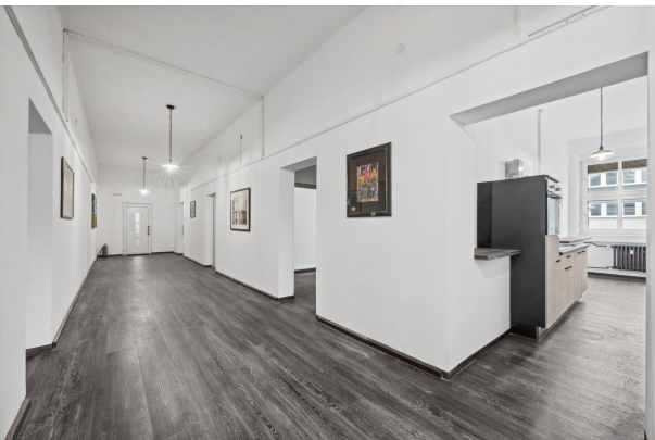
Küche im 1. OG